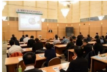
環境マネジメントセミナー