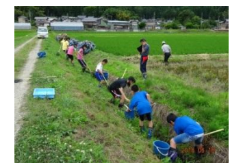
冬水田んぼでの生き物調査