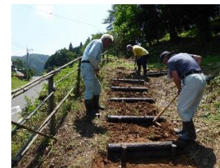
ハッピー山遊歩道整備