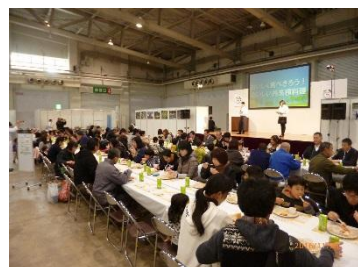
おいしく食べ切ろう！外来種料理